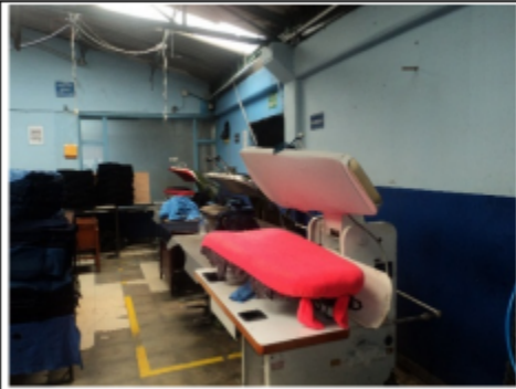
FOTOGRAFÍA 5. ÁREA DE PLANCHADO

ALCALDÍA MAYOR DE BOGOTÁ D.C. SECRETARÍA DE AMBIENTE