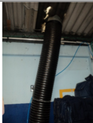
FOTOGRAFÍA 9. DUCTO DE LA SECADORA