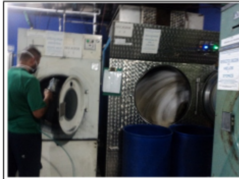
FOTOGRAFÍA 6. SECADORAS