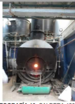
FOTOGRAFÍA 10. CALDERA 120 BHP