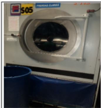
FOTOGRAFÍA 7. SECADORA